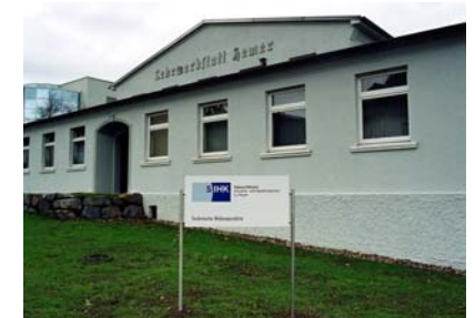
Technische Bildungsstätte Hemer

Berufsausbildung in einer außerbetrieblichen Einrichtung und / oder in einem Kooperationsbetrieb (BaE kooperativ)