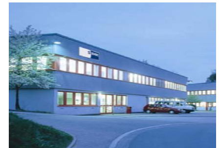
Technische Bildungsstätte Lüdenscheid

Berufsausbildung in einer außerbetrieblichen Einrichtung und / oder in einem Kooperationsbetrieb (BaE kooperativ)